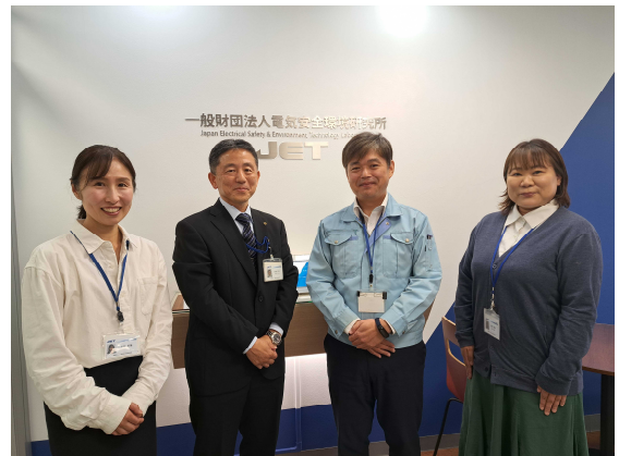
情報システム部のスタッフ